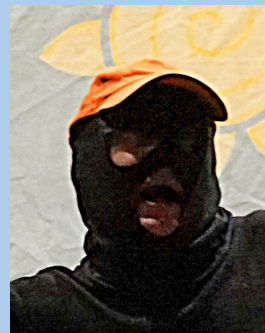
BERNARD LE CANARD

Fille de l'inspectrice Cornichon, médecin et qui la suit dans ses enquêtes.